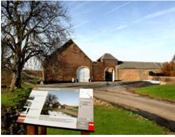
Ferme de Nevaucourt