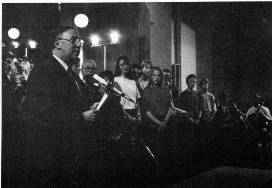
Remise des prix par le Ministre Lebrun à l'Ensemble "Musiques du Monde".