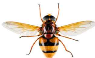
Volucelle zonée, Volucella zonaria

De nombreuses mouches (Diptères) peuvent ressembler à des guêpes ou des frelons. Mais à la différence de ceux-ci elles ne possèdent qu'une seule paire d'ailes au lieu de deux. Leurs yeux sont généralement beaucoup plus globuleux et leurs antennes plus courtes.