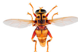
Milésie faux-frelon, Milesia crabroniformis