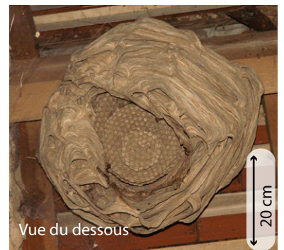
Vue du dessous