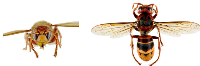
Frelon d'Europe, Vespa crabro

Le frelon d'Europe , Vespa crabro , a l'abdomen à dominante jaune clair, avec des bandes noires. Sa tête est jaune de face et rouge au dessus. Son thorax et ses pattes sont noirs et brun-rouges. Les ouvrières mesurent entre 18 et 23mm et les reines entre 25 et 35.