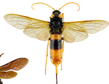
Sirex géant, Urocerus gigas

Le sirex géant est un Hyménoptère dont la larve se nourrit de bois. La femelle peut atteindre 4,5 cm, a une coloration proche du frelon asiatique, mais s'en distingue facilement par des antennes longues entièrement jaunes ainsi que par la présence d'une longue tarière lui permettant de pondre dans le bois. Cet insecte est inoffensif.