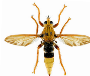
Asile frelon, Asilus crabroniformis