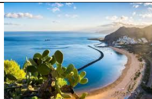
Les Iles Canaries