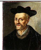
Rabelais, moine truculent et médecin voyageur