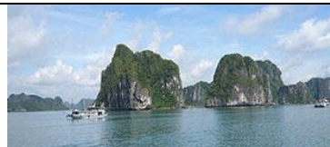
Le Vietnam, Les princesses et le dragon