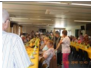
Goûter de la chorale « Espoir »