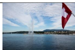
Le lac Léman