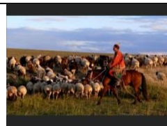
La Mongolie nomade