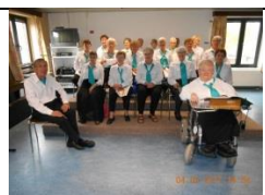
Concert de Noël par la chorale « Espoir »