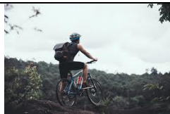
de la Loire à la Mer Noire